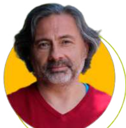
Director del Programa